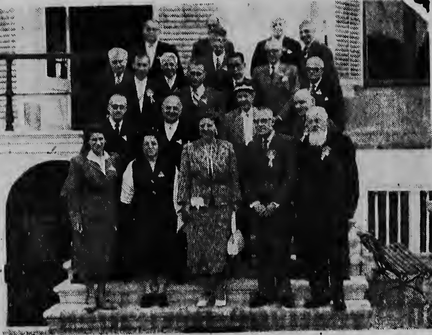
Op 4 September heeft H.M. de Koningin op Paleis Soestdijk deelnemers aan het Internationaal Tuinbouwcongres ontvangen. De foto toont de Landsvrouw temidden van de deelnemers.